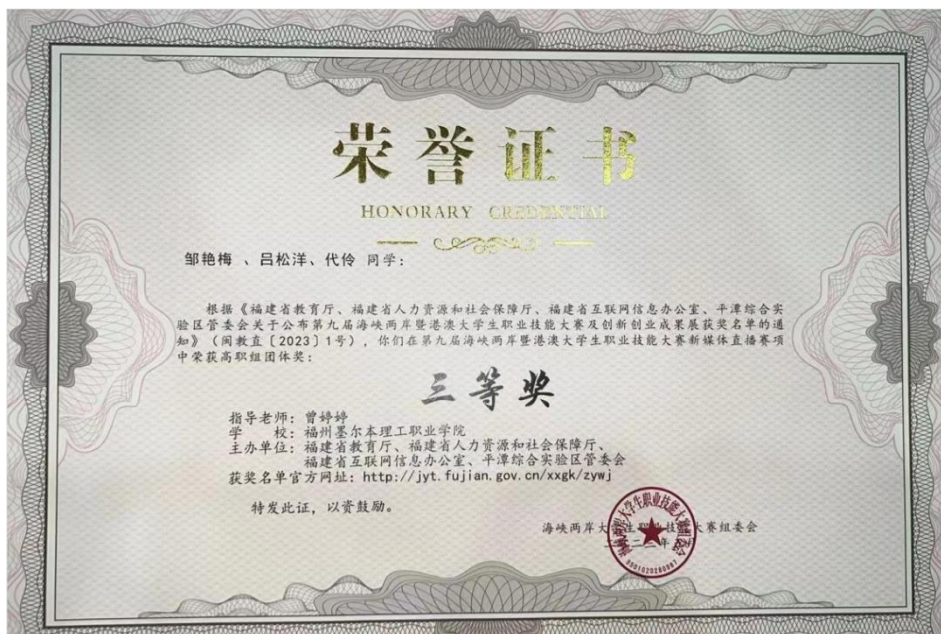
图 4.6 第九届海峡两岸暨港澳大学生职业技能大赛新媒体直播赛项团体三等奖