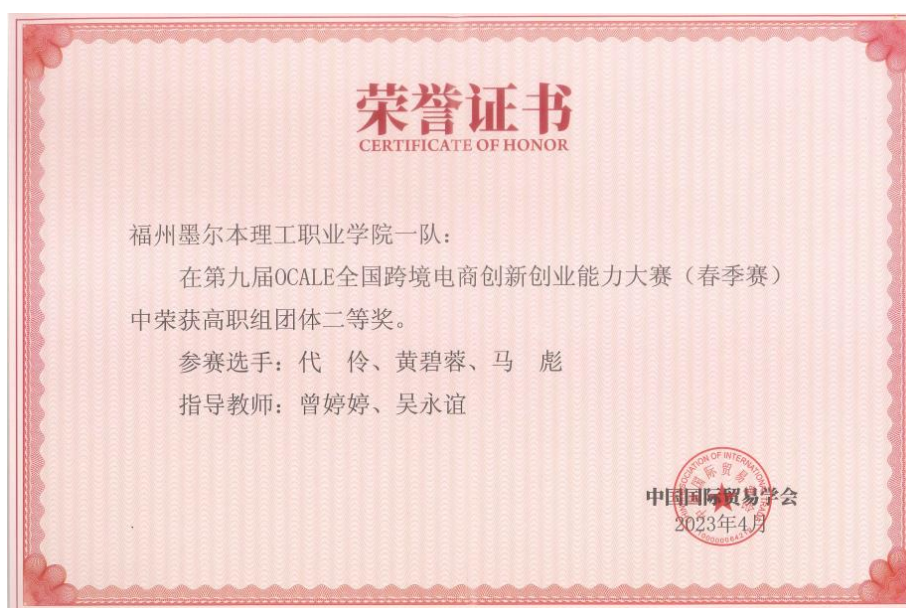
图 4.4 第九届 OCALE 全国跨境电商创新创业能力大赛获团体二等奖奖状