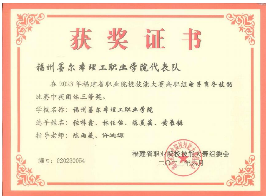
图 4.5 福建省大学生职业技能比赛电商赛项三等奖