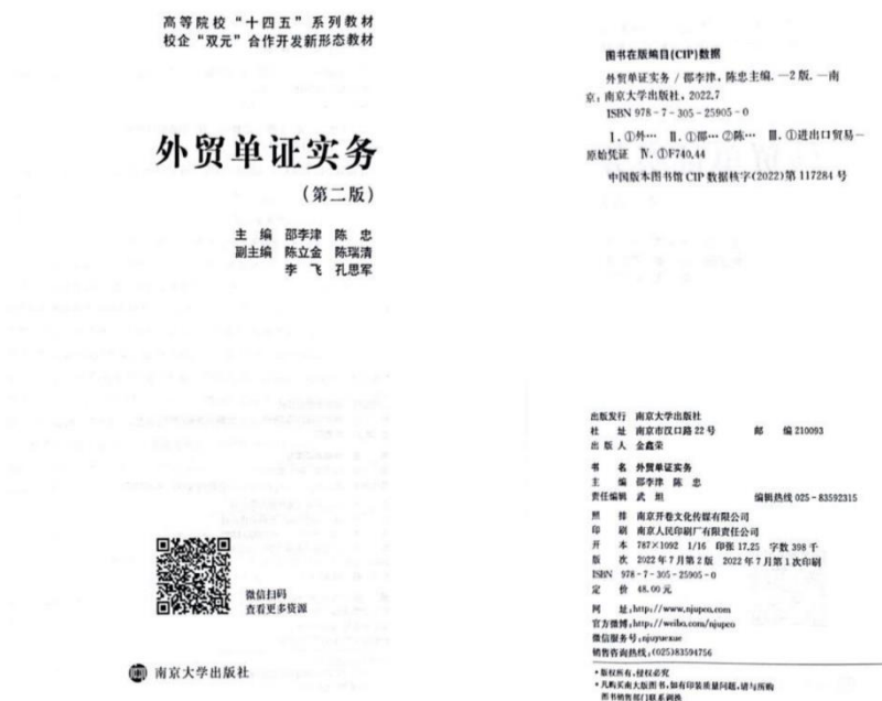
图 4.14 《外贸单证实务》教材