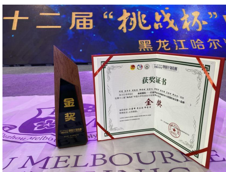
图 4.3 “挑战杯”中国大学生创业计划竞赛金奖奖杯及奖状