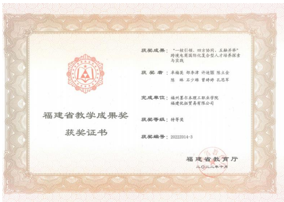
图 4.7 教学成果特等奖