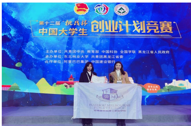
图 4.2 福州墨尔本理工职业学院学子获“挑战杯”中国大学生创业计划竞赛金奖