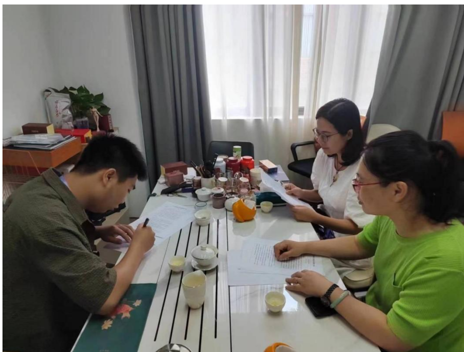
图 4.8 福州墨尔本理工职业学院专任教师与企业导师共同论证人才培养方案