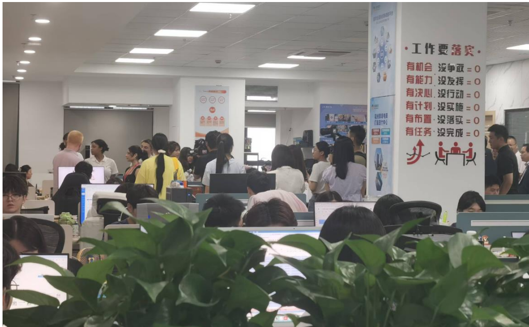
图 7 学生在校外实训基地学习