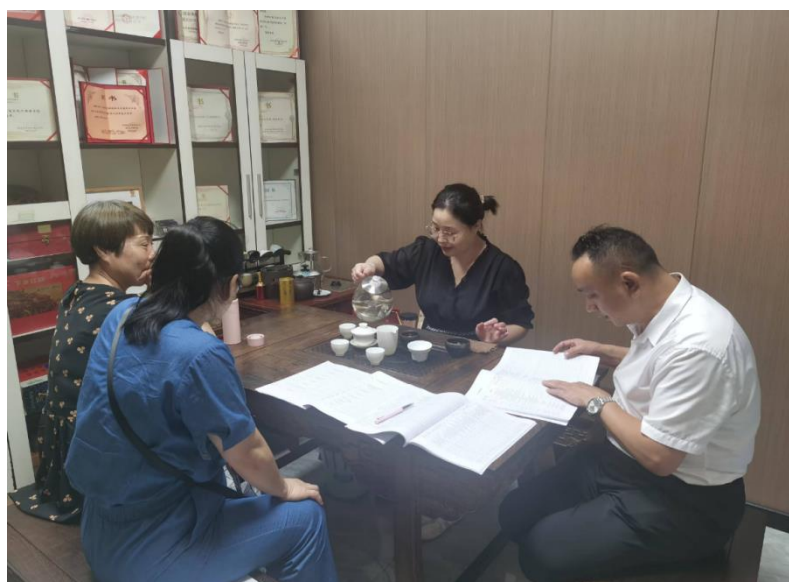
图2 国商系专任教师与企业导师共同论证人才培养方案

2024年8月，国际商务系国贸电商教研室主任及专任教师与企业专家共同研讨人才培养方向及教学标准。（如图2所示）