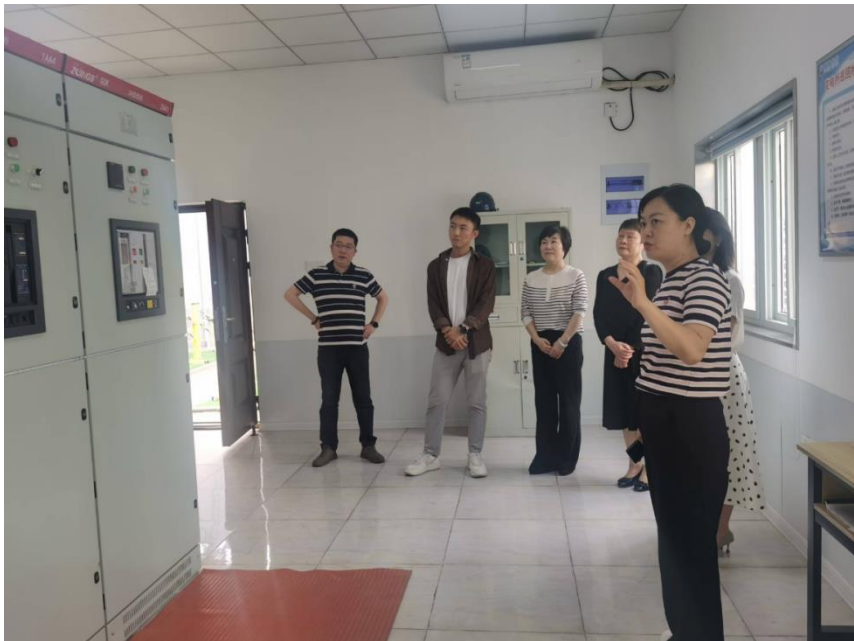
图5 校领导与国商系教师走访校外实训基地

校企双方紧密合作，共同规划并构建了集校内实训中心与校外实训基地于一体的实践教学体系，旨在全方位、多层次地强化学生的职业技能与实践能力。通过这一体系，学生不仅能在校内实训中心接受到模拟真实工作环境的训练，还能在校外实训基地亲身体会企业的实际运营，从而在理论与实践的双重培养下，全面提升个人职业素养与岗位适应能力。校内的高水平跨境电商虚拟仿真实训基地获批省级职业教育示范性虚拟仿真实训基地。