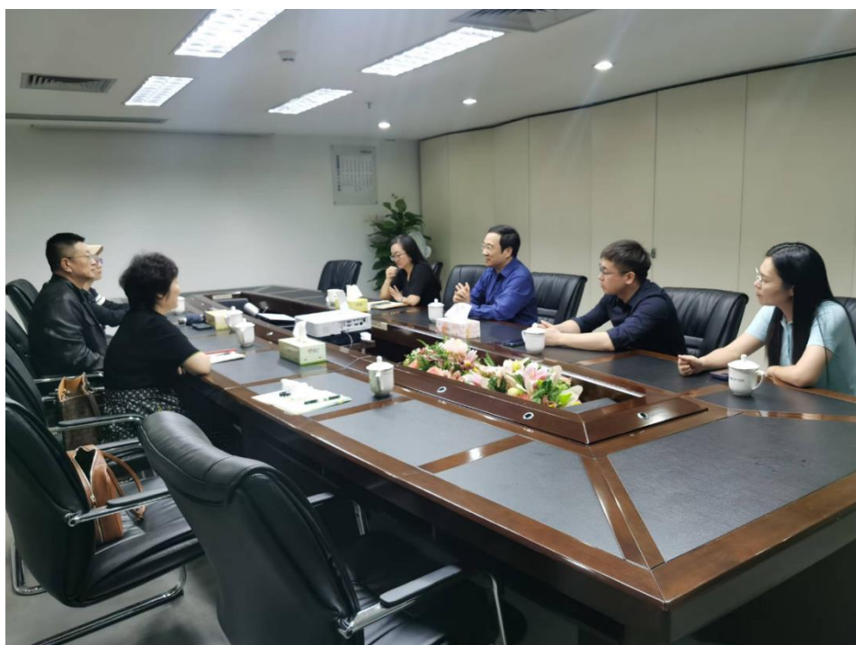
图1 与优拓公司开展专业建设座谈会

2024年8月，国际商务系国贸电商教研室主任及专任教师与企业专家共同研讨人才培养方向及教学标准。（如图2所示）