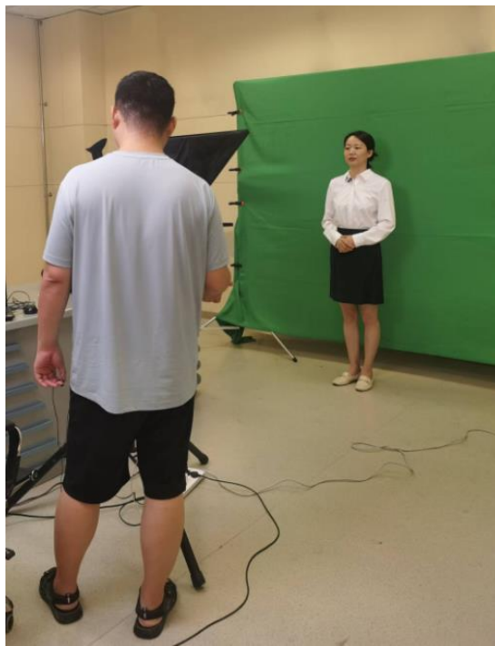
图 3 精品课程拍摄