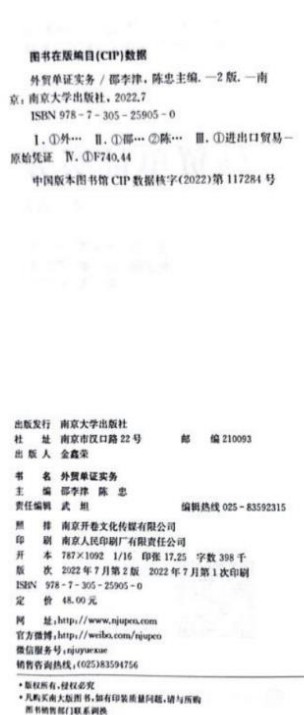
图4 《外贸单证实务》教材