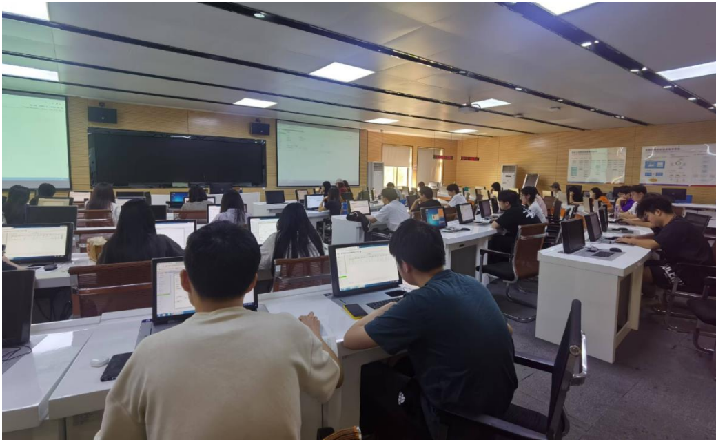
图 6 学生在校内实训基地进行虚拟仿真实训